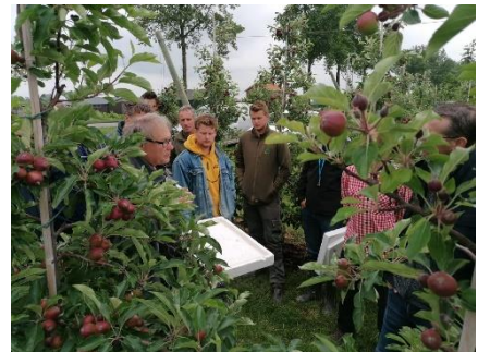
Deelnemers kijken welke insecten aanwezig zijn in fruitboomgaard tijdens veldexcursie.

Het afgelopen jaar is de aandacht hiervoor ook toegenomen in de akkerbouw en melkveehouderij. In de akkerbouw wordt er meer gekeken naar de toepassing van groenbemesters en het inpassen ervan in de grondbewerking. De melkveehouders hebben mooie voorbeelden gezien van productief kruidenrijk grasland. De deelnemers werken allen aan de verduurzaming van hun bedrijfsvoering gericht op de toekomst van hun bedrijven.